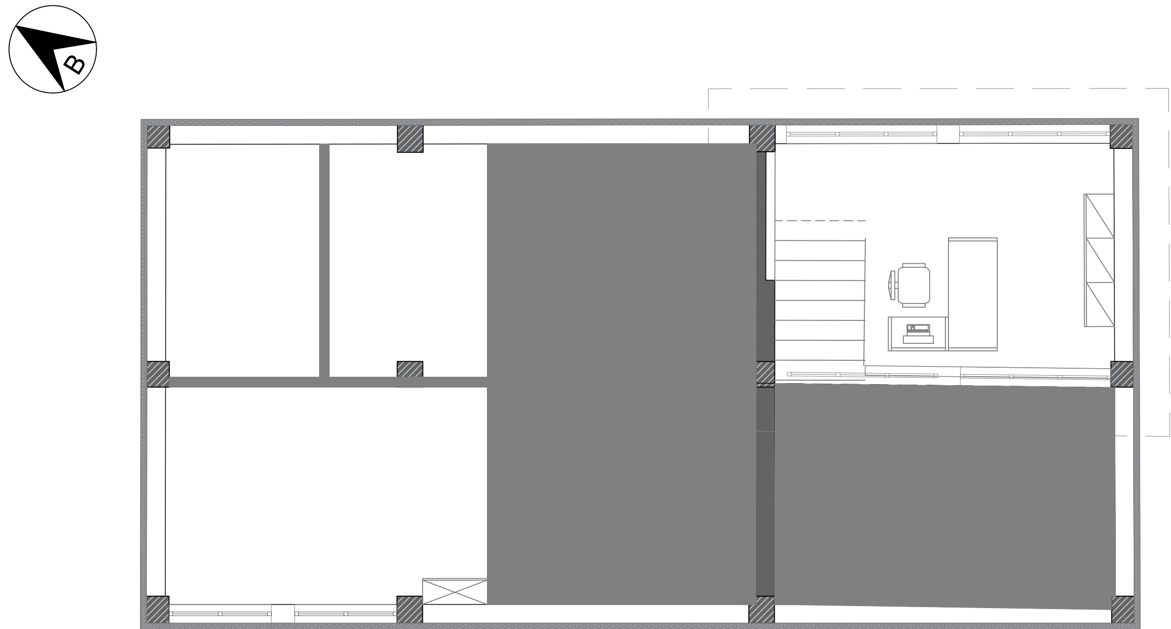
ΚΑΤΩΦΗ ΠΑΤΑΡΙΟΥ (ΣΤΑΘΜΗ +4.27)